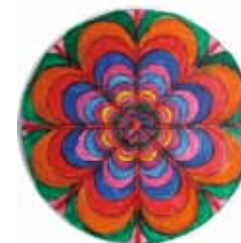
C. S. E. “Mandala”

Contatto: Ufficio di Coordinamento Attività Principali e Complementari