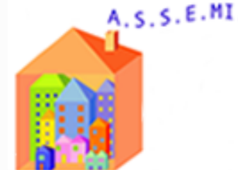
Azienda Sociale Sud Est Milano